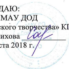
ГРАФИК ПОВЫШЕНИЯ КВАЛИФИКАЦИИ ПЕДАГОГОВ НА ПЕРВОЕ ПОЛУГОДИЕ 2018-2019 уч. г.